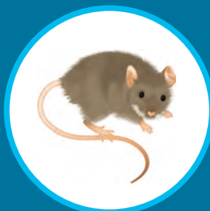
Souris Mus musculus (adultes et juvéniles)