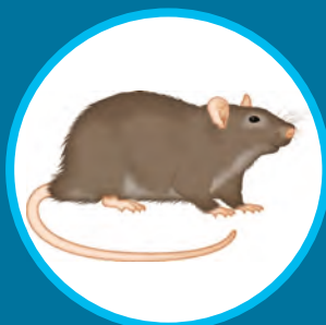
Rat noir Rattus rattus (adultes et juvéniles)