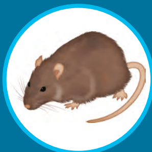
Rat brun Rattus norvegicus (adultes et juvéniles)